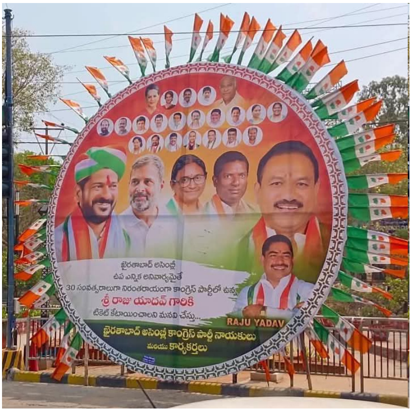
ఖైరతాబాద్ నియోజకవర్గానికి ఉప ఎన్నికలు తప్పవని సదరు నేత ఈ ప్రకటన ఏర్పాటు చేసినట్లుగా తెలుస్తోంది. ఉప ఎన్నికలు ఒక నియోజకవర్గానికి మాత్రమే వస్తాయా లేదా అనేది భవిష్యత్తులో తేలనుంది.