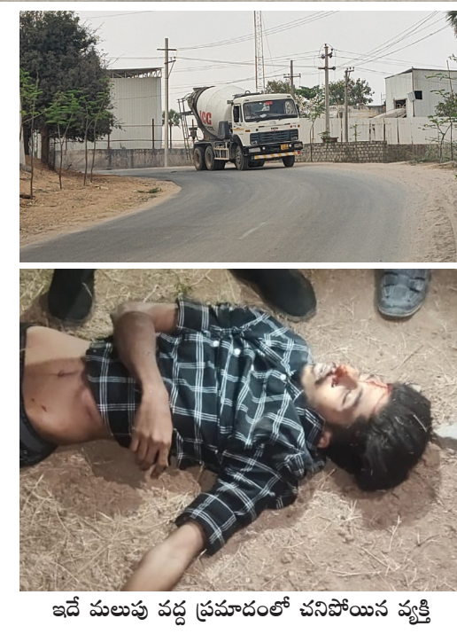
ఇదే మలుపు వద్ద ప్రమాదంలో చనిపోయిన వ్యక్తి

మహేశ్వరం, మార్చి 22 (ప్రజాకలం ప్రతినిధి): ఈ మలుపు మృత్యుమలుపు అని గ్రామ ప్రజలు భయాందోళన చెందుతున్నారు. రంగారెడ్డి జిల్లా మహేశ్వరం నియోజకవర్గం తుక్కుగూడ మున్సిపల్ రావిరాల గ్రామంలో చెరువు కట్ట కింద రోడ్డు మలుపు ఉండడంతో అక్కడ స్పీడ్ బ్రేకర్ లేకపోవడంతో అదేవిధంగా లైట్లు కూడా లేకపోవడంతో స్పీడ్ గా వాహనాలు వచ్చి అదుపు చేయలేకపోవడంతో ప్రమాదాలు జరుగుతున్నాయని స్థానిక ప్రజలు వాపోతున్నారు. చిక్కజల్ల మలుపు కనిపించక స్పీడ్ గా వచ్చి అదుపు చేయలేక ప్రమాదాలు జరిగి చాలామంది ప్రమాదాలు కోల్పోయారని అయినప్పటికీ మున్సిపల్ కమిషనర్ అధికారులు నాయకులకు మాత్రం పట్టించు లేకపోవడం శోచనీయం ఎన్నోసార్లు ప్రమాదాలు జరుగుతున్న ఆయన పత్రికల్లో వచ్చిన స్థానిక ప్రజలు చెప్పిన మున్సిపల్ అధికారులు నాయకులు పట్టించుకోకపోవడం నాయకుల అధికారుల నిర్లక్ష్యానికి నిదర్శనంగా ఉందని స్థానిక ప్రజల ఆగ్రహం వ్యక్తం చేస్తున్నారు. తక్షణమే స్పీడ్ బ్రేకర్ తో పాటు లైట్లు ఏర్పాటు చేసి మూలం మలుపు వద్ద ప్రమాద సూచిక బోర్డు ఏర్పాటు చేయాలని స్థానిక ప్రజలు కోరుతున్నారు.