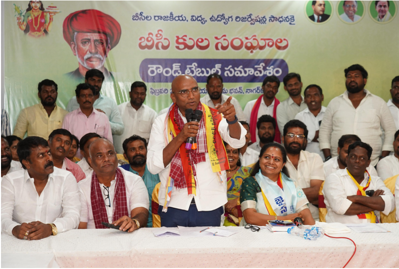
నాగర్ కర్నూల్ ఫిబ్రవరి 28 (ప్రజా కలం ప్రతినధి)

కాలేజర్ కమిషన్ సిఫార్సులు కాంగ్రెస్ పట్టించుకోలేదు కెసిఆర్ హయాంలో బిసి గురుకులాలు భేష్ బిసి రౌండ్ టేబుల్ సమావేశంలో డా.ఆర్ఎస్ ప్రవీణ్ కుమార్