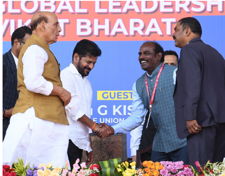
SHRI RAJNATH SINGH, HON'BLE RAKSHA MANTRI, GOVT OF INDIA