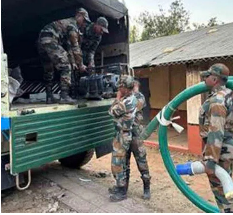
మొదటి పేజీ తరువాయి...

ప్రమాదం జరిగిన టన్నెల్ 14వ కిలోమీటర్లకు సమీపంలో 13.5 కిలోమీటర్ల వద్దకు రక్షణ బృందాలు చేరుకున్నాయి. 11వ కిలోమీటర్ల వరకు లోకాల్ ట్రైన్ వేళ్లిన సహాయక సిబ్బంది అక్కడి నుంచి నడుచుకుంటూ వచ్చారు. 13.5 నుంచి 14 కిలోమీటర్ల మధ్యలో కార్మికులు చిక్కుకొని ఉంటారని సహాయ బృందాల అధికారులు భావిస్తున్నారు. అక్కడి పరిస్థితిని అంచనా వేస్తూ సహాయక చర్యలపై నిపుణులతో చర్చిస్తున్నారు. ఘటన స్థలానికి వెళ్లేదేరా? టన్నెల్ కుడి, ఎడమ, పైభాగం నుంచి డ్రిల్లింగ్ చేసి, ఘటన స్థలానికి చేరుకునే సాధ్యసాధ్యాలపై నిపుణుల సలహాలే తీసుకుంటున్నారు. టన్నెల్లోని మట్టి దిబ్బలను తొలగిస్తున్నారు. 1000 హోల్స్ పవర్ మోటర్ నీటిని బయటకు పంపుతున్నారు. సహాయ చర్యల్లో 130 మంది ఎన్సీఆర్ఎఫ్, 24 మంది హైద్రా, 24 మంది సైనికులు, 24 మంది సింగరేణి రి స్కూల్ టీమ్, 120 మంది ఎన్వీఆర్ఎఫ్ సి బృంద