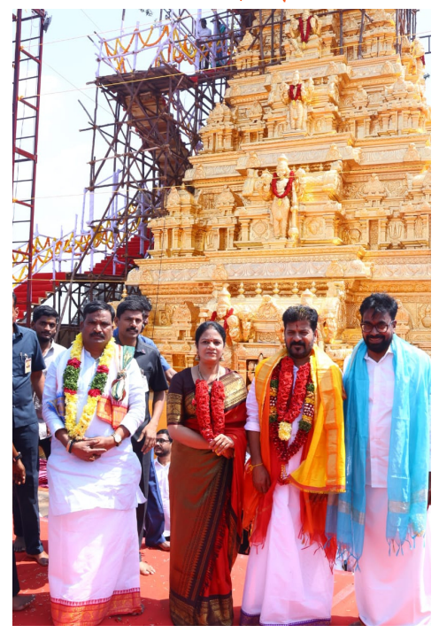
యాదాద్రి భువనగిరి ఫిబ్రవరి 23 (ప్రజా కలం ప్రతినిధి) రాష్ట్ర ప్రజలు ఎప్పుడెప్పుడూ అని అద్భుత అవిష్కృతం అయ్యింది. సీఎం రేవంత్ రెడ్డి చేతుల మీదుగా యాదగిరిగుట్ట నరసింహాడి స్వర్ణ గోపురాన్ని ఆవిష్కరించారు. అనంతరం కుంభ సంక్రొక్షణ పూజలు