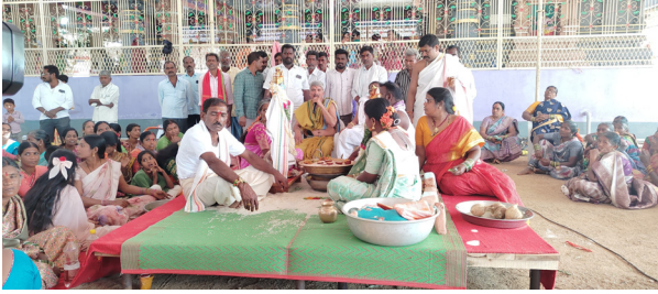
సిద్దిపేట జిల్లా ప్రజాకలం ప్రతినిధి ఫిబ్రవరి 23, రాయపోల్ మండల పరిధిలోని అనాజూర్ గ్రామంలో పెద్దమ్మ పెద్దిరాజుల కళ్యాణ మహోత్సవం ముదిరాజ్ సంఘ ఆధ్వర్యంలో అంగరంగ వైభవంగా నిర్వహించారు. ప్రథమ

వార్షికోత్సవంలో భాగంగా మూడు రోజులు ఘనంగా నిర్వహించి, చివరి రోజు ఆదివారం పెద్దమ్మ పెద్దిరాజుల వివాహం జరిపించారు. శతాధియుక్త, మహా బలాభిషేకం, అమ్మవారికి దుర్బలి, విశ్వరూప సందర్శనం, మహా పూజాహారతి వంటి కార్యక్రమాలను వేద పండితులతో ఛాత్రోయుక్తంగా అమ్మవారి కళ్యాణం ఘనంగా నిర్వహించారు. భక్తులకు ఎటువంటి ఇబ్బంది లేకుండా మధ్యాహ్నం అన్నదాన కార్యక్రమని నిర్వహించడం జరిగింది. సాయంత్రం అమ్మవారికి గ్రామస్థులు బోనాలు ఎత్తుకొని అమ్మవారికి మొక్కులు చెల్లించుకొని సమర్పించారు. అనంతరం పోతరాజులు వీరగంగ, గావు వంటి కార్యక్రమాలు శివనత్తుల ఆటపాటలతో నిర్వహించారు. ఈ కార్యక్రమంలో గ్రామస్థులు, వివిధ గ్రామాల ప్రజలు తదితరులు పాల్గొన్నారు.