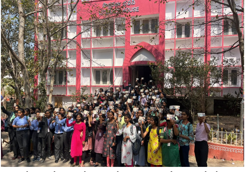
పై రాసి లేఖలను ధిల్లీకి పోస్టు చేశారు. అంతే కాదు కాంగ్రెస్ పార్టీ ఇచ్చిన హామీల్లో భాగంగా 4,000 రూపాయల నిరుద్యోగ భృతి ఎప్పటి నుండి అమలు చేస్తారో చెప్పాలని డిమాండ్ చేశారు.

హైదరాబాద్, ఫిబ్రవరి 14 (ప్రజా కలం ప్రతినిధి) చదువుకుంటున్న విద్యార్థిణిలు రోడ్డు ఎక్కే పరిస్థితి వచ్చింది. కాంగ్రెస్ పార్టీ అధికారం కోసం ఇచ్చిన హామీలను నెరవేర్చాలని డిమాండ్ చేస్తున్నారు.