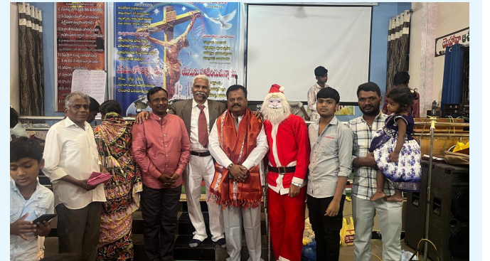
మహేశ్వరం, డిసెంబర్ 25, (ప్రజా కలం)