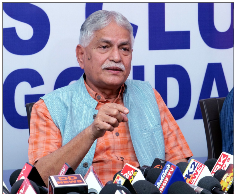
నల్గొండ డిసెంబర్ 30 (ప్రజాకలం ప్రతినధి):

ప్రెస్ క్లబ్ కార్యక్రమాలను కొనసాగించడానికి నల్గొండ ప్రెస్ క్లబ్ చేస్తున్న కృషి అభినందనీయమని తెలంగాణ మీడియా అకాడమీ చైర్మన్ కే. శ్రీనివాస్ రెడ్డి అన్నారు. పదేళ్లుగా జర్నలిస్టులు ఎదురు చూస్తున్న ఇళ్ల స్థలాల కేటాయింపు కోసం రాష్ట్ర ప్రభుత్వం ప్రయత్నిస్తున్న సందర్భంలో సుప్రీంకోర్టు తీర్పు దిగ్భ్రాంతి కలిగించింది. ఐఎన్, ఐఎన్, ఎంపీలు, ఎమ్మెల్యేలతో సమానంగా జర్నలిస్టులను చూడడం నివేదించబడినా, దీనిపై న్యాయనిపుణులతో సంప్రదిస్తున్నట్లు తెలిపారు. జర్నలిస్టుల అక్రమీకీషన్లపై కమిటీ రిపోర్ట్ అందజేసింది, హెల్త్ కార్డులపై షిమాకుంపెనీలతో సంప్రదింపులు నిర్వహిస్తున్నట్లు శ్రీనివాస్ రెడ్డి తెలిపారు. సోమవారం సల్ గాండ్ ప్రెస్ క్లబ్ నిర్వహించిన మీట్ ది ప్రెస్ కార్యక్రమంలో శ్రీనివాస్ రెడ్డి పాల్గొన్నారు. ఈ సందర్భంగా పలు అంశాలపై ఆయన మాట్లాడారు.