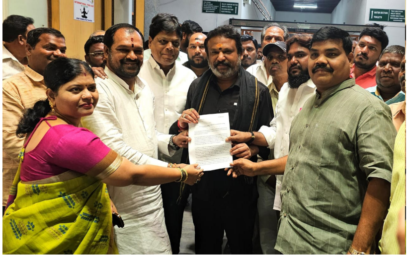
హైదరాబాద్, డిసెంబర్ 30 (ప్రజాకలం ప్రతినధి):

బ్రిగేడియర్, ఎమ్మెల్యే, సిఈఓలకు వినతిపత్రం