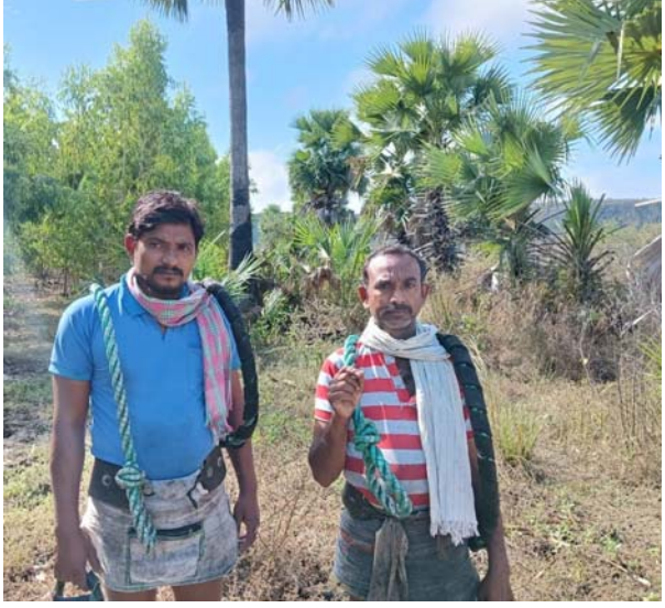
గతంలో నిండు అసెంబ్లీ లో మాట ప్రకారం సోసైటీ లను పునరుద్ధరణ చేసి గీత కార్మికులకు 4% సర్టిఫికేట్ లు ఇవ్వాలని డిమాండ్ చేశారు. తేకపోతే అన్ని జిల్లాల ఏజెన్సీ గీత కార్మికులతో కల్లు గీత కార్మికుల సంఘం ఆధ్వర్యంలో పాదయాత్రలు ఆందోళన కార్యక్రమాలు నిర్వహించడం జరుగుతుందని రవిగౌడ్ అన్నారు.

ములుగు జిల్లా ప్రతినిధి, డిసెంబర్ 29 ప్రజాకలం:- ములుగు : (సర్కూలర్) : ఏజెన్సీ లో గత 24 సంవత్సరాలనుండి రద్దు చేసిన గీత సోసైటీ లను తక్షణమే పునరుద్ధరణ చేసి అన్ని రకాల సంక్షేమ పథకాలు అందించాలని కల్లు గీత కార్మికుల సంఘం జిల్లా ప్రధాన కార్యదర్శి గుండెబోయిన రవిగౌడ్ ప్రభుత్వాన్ని డిమాండ్ చేశారు. ప్రతి పక్షంలో ఉన్నప్పుడు ఇప్పుడు ఉన్న ముఖ్యమంత్రి రేవంత్ రెడ్డినిండు అసెంబ్లీ లో గత ప్రభుత్వాన్ని ఏజెన్సీ లో కల్లు గీత కార్మికుల పరిస్థితులువారికి న్యాయంగా దక్కాల్సిన రాజ్యాంగం లోని ఆర్టికల్ 342 ప్రకారం జీవో నంబర్ 5 2014 మరియు జీవో నంబర్ 2 2015 ప్రకారం ఏజెన్సీ సర్టిఫికేట్ న్ తక్షణమే జారీ చేయాలని మాట్లాడటం జరిగిందని రవి గౌడ్ అన్నారు.. ఇప్పుడు ముఖ్యమంత్రి గా రేవంత్ రెడ్డి ఉన్నారా కాబట్టి మాట తప్పకుండా ఏజెన్సీ లో కల్లు గీత సోసైటీ లను వెంటనే పునరుద్ధరణ చేసి గుర్తింపు కార్డులు జారీచేయాలని డిమాండ్ చేశారు. ఏజెన్సీ లో గీత కార్మికులు కేవలం ఓట్లకే పరిమితమౌతూ వారి సంక్షేమం అవసరం లేదా అని అన్నారు.. వారికి కూడ కాటమయ్య రక్షణ కిట్టి ఇవ్వాలి.. ప్రమాదం జరిగితే ఎక్స్ గ్రేషియూలు 50 సంవత్సరాలకే వృత్తి పింఛన్ ఇవ్వాలని డిమాండ్ చేశారు.. పాలనా ప్రారంభం అయి సంవత్సరం అయినా కూడ కల్లు గీత కార్మికుల సమస్యలు అలాగే ఏజెన్సీ లో కల్లు గీత కార్మికుల గురించి మాట్లాడక పోవడం సమంజసం కాదని రవిగౌడ్ అన్నారు. ఇప్పటికైనా ముఖ్యమంత్రి