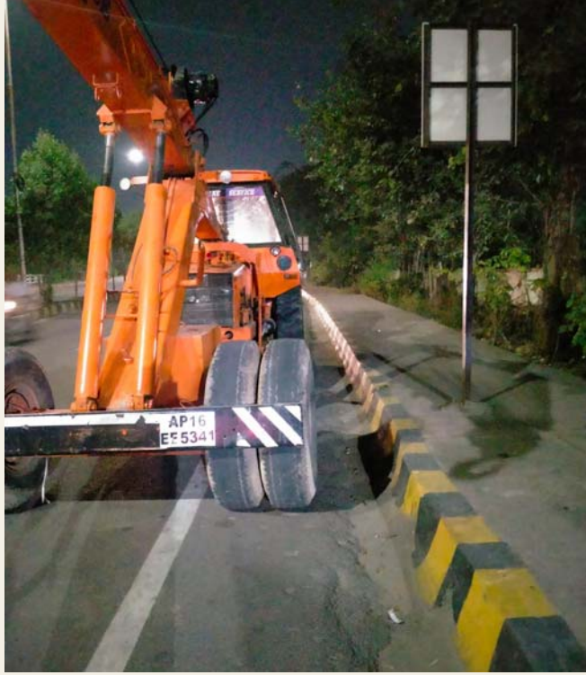
రాజేంద్రనగర్ డిసెంబర్ 21, (ప్రజా కలం)

సెల్ ఫోన్ మాట్లాడుతూ క్రేన్ వాహనాన్ని నడుపుతూ ఓ డ్రైవర్ ముందు వెళ్తున్న స్కూటీ వాహనాన్ని వెనుక నుండి ఢీకొట్టాడు. దీంతో స్కూటీ పై నుండి కింద పడ్డ యువతి తీవ్ర గాయాలకు గురైంది. ప్రమాదం జరిగిన వెంటనే క్రేన్ డ్రైవర్ వాహనాన్ని అదే వేగంతో పారిపోయేందుకు ప్రయత్నించాక స్థానికులు వాహనదారులు పట్టుకొని రాజేంద్రనగర్ పోలీసులకు అప్పగించారు. ఈ సంఘటన శనివారం రాత్రి ఆరున్నర గంటల ప్రాంతంలో రాజేంద్రనగర్ సర్కిల్ కార్యాలయం ప్రధాన ద్వారం వద్ద ఉన్న ప్రధాన రహదారిపై చోటు చేసుకుంది. టిడిపి చౌరస్తా నుండి రాజేంద్రనగర్ వెళ్లేందుకు యువతి స్కూటీ పై వెళ్తుంది క్రేన్ వాహనంతో రాజేంద్రనగర్ వైపు వెళ్తున్న డ్రైవర్ వేగంగా వస్తూ సెల్ ఫోన్ మాట్లాడుతూ యువతి వాహనాన్ని వెనుక నుండి ఢీ కొట్టాడు ఈ సంఘటనలో యువతి తీవ్ర గాయాలకు గురైంది. స్థానికులు యువతని ప్రైవేట్ ఆసుపత్రికి తరలించారు. ప్రమాదం జరిగిన వెంటనే డ్రైవర్ వాహనంతో పారిపోయేందుకు ప్రయత్నించగా స్థానికులు వాహనదారులు పట్టుకొని రాజేంద్రనగర్ పోలీసులకు అప్పగించారు.