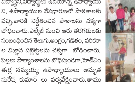
కాల్వల్లి, డిసెంబర్ 21: (ప్రజాకలం ప్రతినీధి) మండలంలోని గంగాం గ్రామపంచాయతీ ఉషన్నపల్లిలోని ఇంగ్లీష్ మీడియం ప్రభుత్వ ప్రాథమిక పాఠశాలలో శనివారం స్వయంపాలన దినోత్సవం ఘనంగా నిర్వహించారు.

భవిష్యత్తులో బాగా చదువుకుని పెరిగి, పెద్దయ్యాక టీచర్లు మృతామనీ వారు ఆశాభావం వ్యక్తం చేశారు. స్వయంపాలన కార్యక్రమానికి ముందు పాఠశాలలో హెచ్ఎం ఆధ్వర్యంలో పిల్లల తల్లిదండ్రుల సమావేశాన్ని నిర్వహించారు.