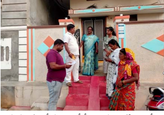
యాదాద్రిగిరిగుట్టలో పట్టణం లో నీ 4 వార్డు అంగడి బజార్లో ఇందిరమ్మ ఇండ్ల సర్వే దృశ్యం.....