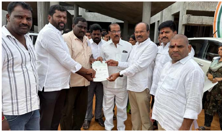
ముఖ్యమంత్రి సహాయ నిధి చెక్కును అందజేస్తున్న కేవలం

లేకుండా నేరుగా రోగులకు, వారి కుటుంబ సభ్యులకు బ్యాంకు ఖాతాల్లో సీఎం రేవంత్ రెడ్డి గారి సర్కార్ జమ చేస్తుందని తెలిపారు. వైద్య ఖర్చులతో సతమతం అవుతున్న వారికి కొద్దిగా సాయం చేయాలని కోరారు. కాంగ్రెస్ ప్రభుత్వం అధికారంలోకి వచ్చిన తర్వాత రోగుల పట్ల మానవతా దృక్పథంతో సీఎం రిలీఫ్ ఫండ్ సహాయం అందిస్తున్నామని కిచ్చెన్న చెప్పారు. గత ప్రభుత్వం కంటే కాంగ్రెస్ ప్రభుత్వంలో