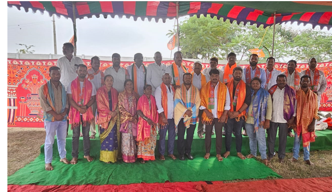
మహేశ్వరం, డిసెంబర్ 21, (ప్రజా కలం)

ప్రజా సంక్షేమం విస్తరించిన కాంగ్రెస్ ప్రభుత్వాన్ని నిలదీయాలి