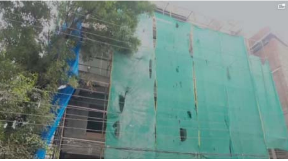
హైదరాబాద్, డిసెంబర్ 20 (ప్రజాకలం ప్రతినది):

- పట్టించుకోని అధికారులు, అభివృద్ధికి తిరోధకాలు