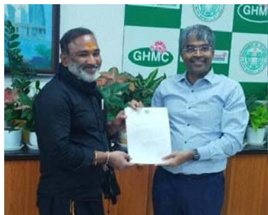
మల్కాజిగిరి, డిసెంబర్ 20, (ప్రజా కలం ప్రతినది)

మెమోరాండం అందించామని వారు దానికి స్పందించి త్వరలోనే మంజూరు చేసేందుకు హామీ ఇచ్చినట్లు చెప్పారు.