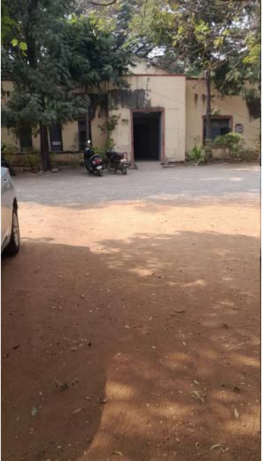
నిజామాబాద్, (ప్రజా కలం ప్రతినది) డిసెంబర్ 20:

లేబర్ కమిషన్ ఆఫీస్ పై కలెక్టర్ ఆజమాయిషి ఉండదా? వారు వచ్చిందే వేళ!