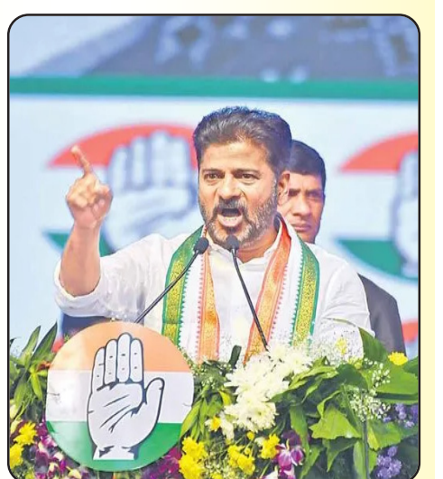
తరువాయి 2వ పేజీలో...

హైదరాబాద్, ఏప్రిల్ 6 (ప్రజాకలం ప్రతినధి): ముఖ్యమంత్రి రేవంత్ రెడ్డి.. తుక్కుగూడ జనజాతర సభ వేదికగా బీఆర్ఎస్ అధినేత కేసీఆర్ కు హెచ్చరికలు జారీ చేశారు. తమ ప్రభుత్వంపై ఇష్టం వచ్చినట్లు మాట్లాడితే ఊరుకోవోనని, చర్లపల్లి జైల్లో చిప్పకూడు తినిపిస్తానని అన్నారు. అధికారంపోయింది, కాలు విరిగింది.. కాతురు జైలుకు వెళ్లిందని మానవత్వంతో ఇన్నాళ్లూ మర్యాదపూర్వకంగా వ్యవహరించామని తెలిపారు. "మమ్మల్ని ఏదీ పడితే అది మాట్లాడితే చూస్తూ ఊరుకునేది లేదు. నేను పెద్దలు జానార్దెలా కాదు. నేను రేవంత్ రెడ్డిని బిడ్డా! నన్ను మాట్లాడే లత్యోరు, లభంగి మాటలకు..