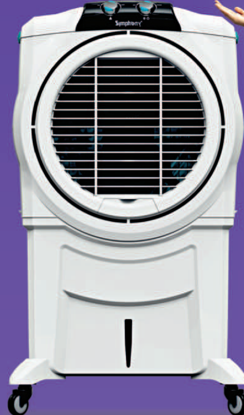
Sumo 115XL MRP (1N) : ₹18,999/- Offer Price (1N) : ₹15,991/-