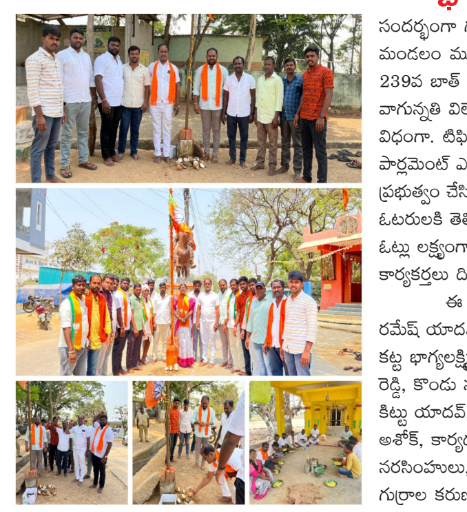
గజ్వేల్ నియోజకవర్గం: 06 ( ప్రజా కలం ప్రతినిధి ) భారతీయ జనతాపార్టీ ఆవిర్భావ దినోత్సవం