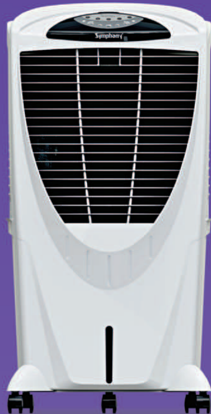
Winter 80 XLI MRP (1N) : ₹17,499/- Offer Price (1N) : ₹13,991/-