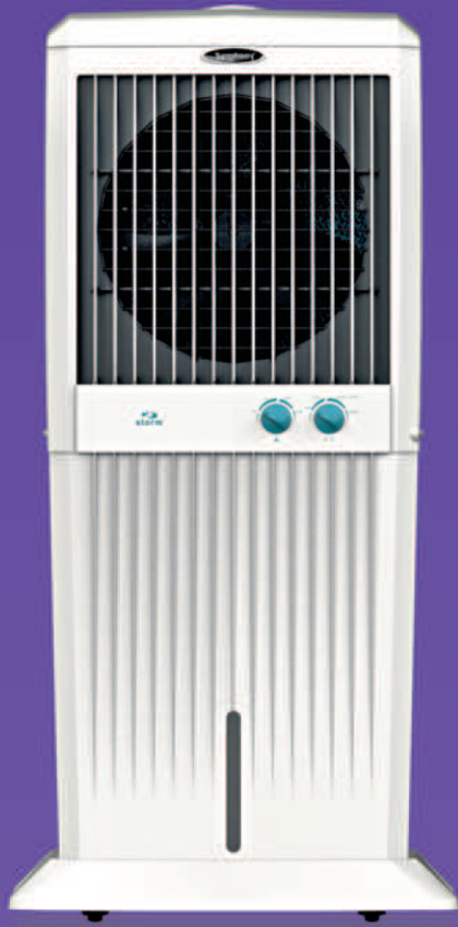
Storm C 100XL MRP (1N) : ₹16,499/- Offer Price (1N) : ₹14,491/-