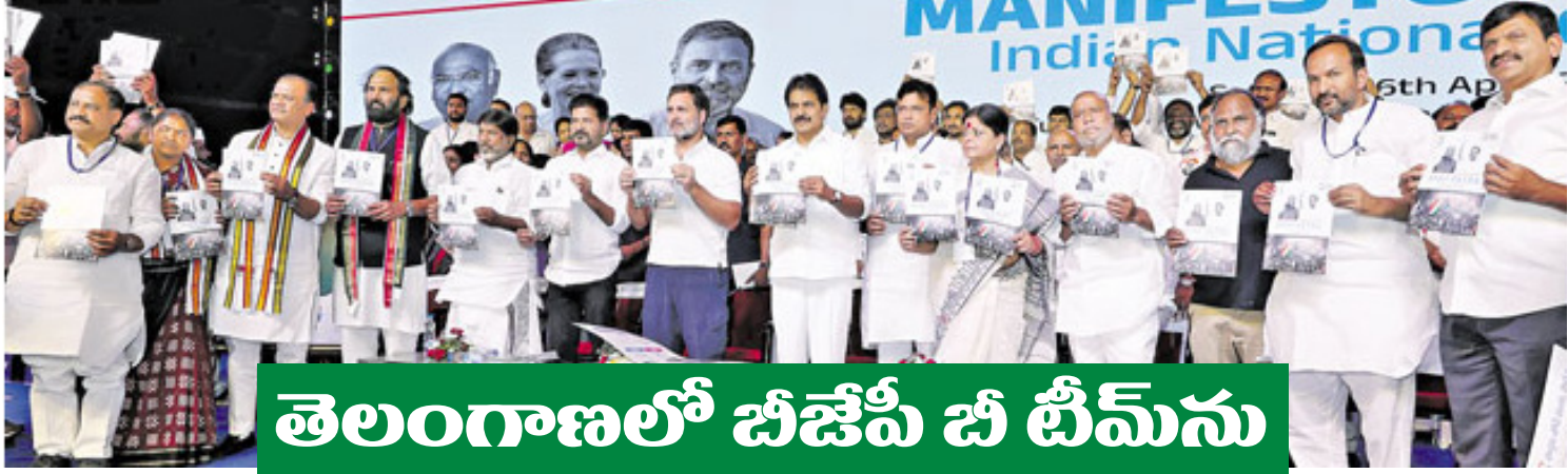
తెలంగాణలో బీజేపీ చీ టీమ్ ను