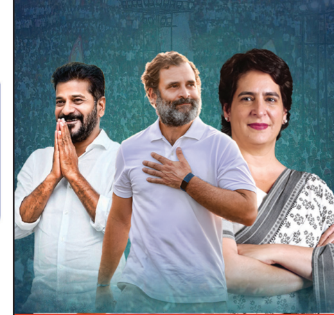
తెలంగాణ ప్రదేశ్ కాంగ్రెస్ కమిటీ

PRAJA KALAM Telugu Daily తెలుగు దినపత్రిక