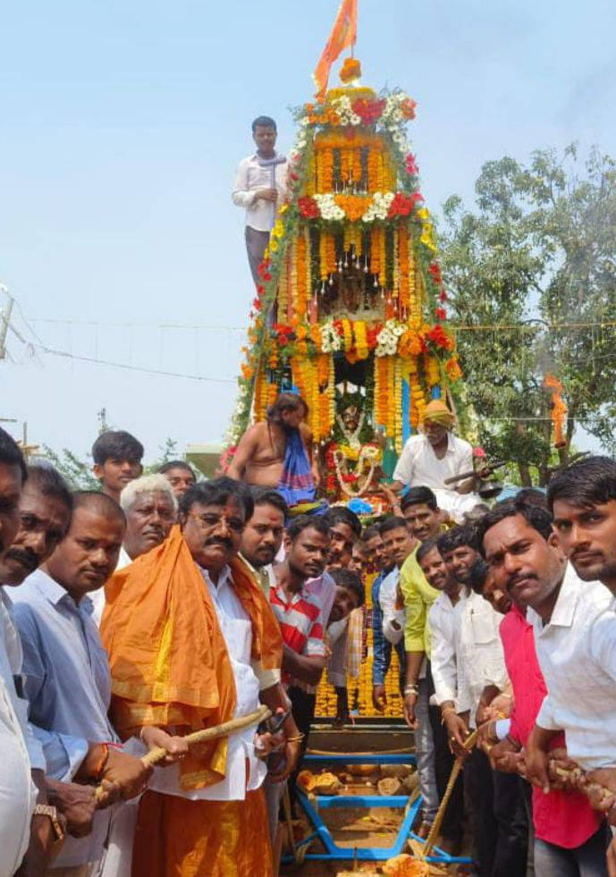
దుబ్బాక / రామిపోల్, ప్రజాకలం ప్రతినిధి ఏప్రిల్ 21. దౌలబాద్ మండలం ఇందుప్రియార్ గ్రామంలో జరుగుతున్న