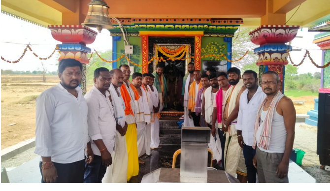
గజ్వేల్ మండలం:21 ఏప్రిల్ 2024 ( ప్రజా కలం ప్రతినిధి ) గజ్వేల్ మండలం అనంతరావుపల్లి గ్రామంలో నాథి శిలా గ్రామదేవతల ప్రతిష్ఠ మహోత్సవ కార్యక్రమాలు వైభవంగా నిర్వహిస్తున్నారు ఆదివారం గ్రామ