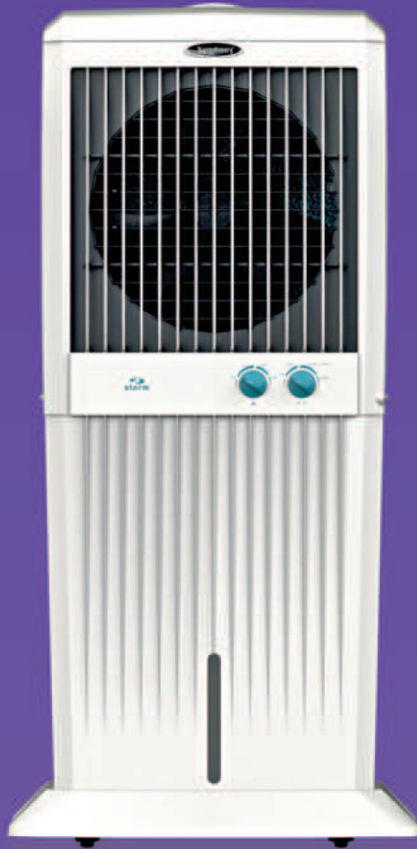
Storm C 100XL