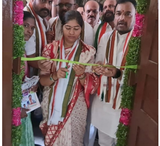
కూకట్ పల్లి, ఏప్రిల్ 19, ప్రజా కలం ప్రతినిధి: మల్కాజ్ గిరి పార్లమెంట్ స్థానంలో తన గెలుపు

-ఎన్నికల తర్వాత ఎమ్మెల్యే చేరువుల కబ్జాలను బట్టబయలు చేస్తాం -అవినీతి, అక్రమాలను బయటకు తీస్తాం -కాంగ్రెస్ సీనియర్ నాయకులు సత్యం శ్రీరంగం