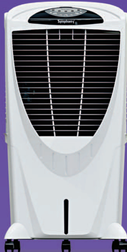
Winter 80 XLi