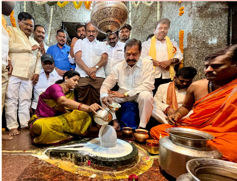
శ్రీ శివగంగా ఆలయంలో