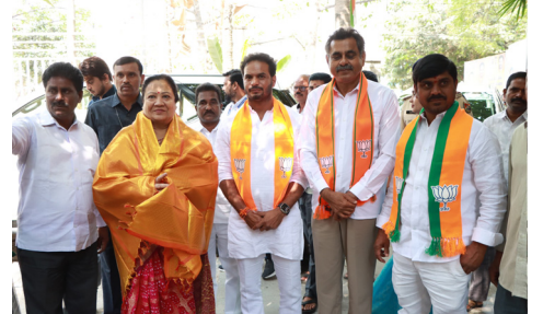
చేవెళ్ల, మార్చి 06, (ప్రజా కలం) భారత్ ప్రధాని సరేంద్ర మోడీ "శక్తి వందన్ "మహిళా స్వయం సహాయక సంఘాలు, ఎన్నికల సంవర్ష

అభియాన్ కార్యక్రమంలో భాగంగా మహిళలతో వర్చువల్ గా మనీడ్ బండ, బీజేపీ కార్యాలయం, కొండాపూర్, శేరిలింగంపల్లి అసెంబ్లీ పరిధిలో జరిగిన కార్యక్రమానికి ముఖ్య అతిథిగా కేంద్ర రైల్వే, జౌళి శాఖ సహాయ మంత్రి దర్శన జర్డోష్ విక్రమ్, చేవెళ్ల పార్లమెంట్ భారతీయ జనతా పార్టీ అభ్యర్థి కొండా విశ్వేశ్వర్ రెడ్డి, హాజరు అయినారు. భారతీయ జనతా పార్టీ రాష్ట్ర స్థాయి, జిల్లా స్థాయి, నియోజకవర్గ స్థాయి, డివిజన్ స్థాయి, మహిళా మోర్చా నాయకురాలు, బీజేపీ ఎంపీ నాయకులు కార్యకర్తలు పాల్గొన్నారు.