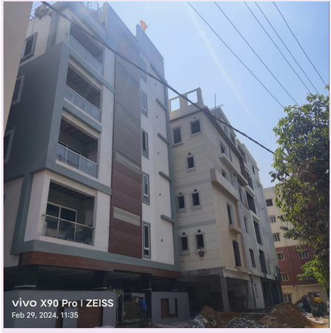
కూకట్ పల్లి, మార్చి 06, ప్రజా కలం ప్రతినీధి: కూకట్ పల్లి జోన్లో పరిధిలోని జంట సర్కిల్లో అడ్డగోలుగా అక్రమ నిర్మాణాలు చేపడుతున్న అధికారులు పట్టించుకోవడం లేదు. అక్రమాలను అడ్డుకోవలసిన అధికారులే అక్రమ నిర్మాణాలను ప్రోత్సహిస్తూ జిహెచ్ఎంసి ఆదాయానికి భారీగా గండి

-అక్రమాలను ప్రోత్సహిస్తున్న పసీపీ మరియు టౌన్ ప్లానింగ్ అధికారి -జిహెచ్ఎంసి ఆదాయానికి గండి కొట్టి జేబులు నింపుకుంటున్న అధికారులు