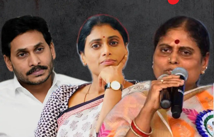
విజయవాడ, జనవరి 17